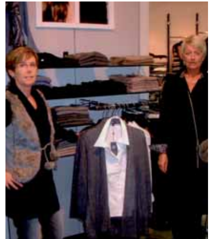
Fachkundige Beratung in einer tollen Atmosphäre