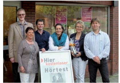
Das Team vor den neugestalteten Räumlichkeiten und

TV-Verstärkungen in Kombination mit Hörgeräten..