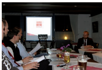
Gutbesuchte Veranstaltung beider Gewerbevereine